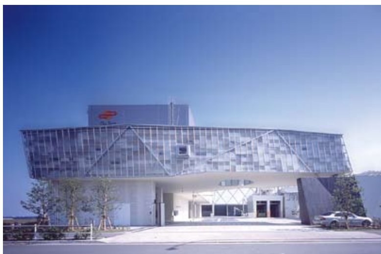
リーテム東京工場

金属リサイクルの中でも特に使用済製品の処理に特化したプラントでの破碎・選別工程をご視察頂きます。