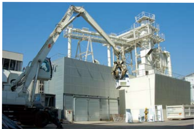
リーテム東京工場