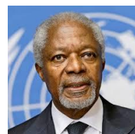
コフィー・アッタ・アナン氏 (1938/4/8～2018/8/18) 2001年ノーベル平和賞受賞 第7代国際連合事務総長

SDGsは、1999年の世界経済フォーラム（ダボス会議）で、当時の国連事務総長のコフィー・アナン氏が問題提起したことから始まった、ミレニアム開発目標（Millennium Development Goals）：MDGs 8つの目標（2000～2015年まで）の改訂版です。